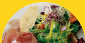
GASTRONOMISCHER TREFFPUNKT ALBATROS

DAS MAGAZIN FÜR KUNDEN, SPENDENDE UND PARTNER DES WBZ