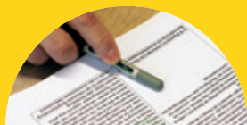
ZUM «GESETZ ÜBER DIE BEHINDERTENHILFE»