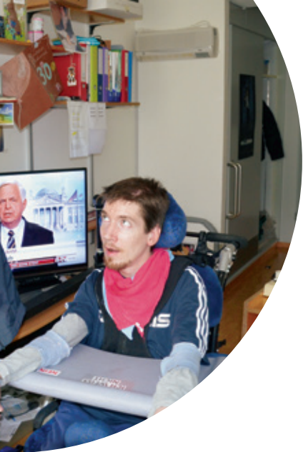
Ein Ausschnitt aus der Vielfalt an bewährten Pflege-, Therapie-, Arbeits- und Freizeitangeboten im WBZ.