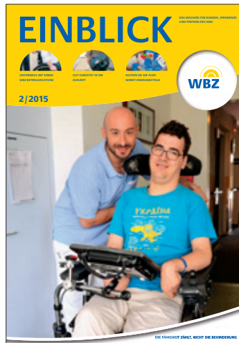
Das WBZ als «runde Sache», nicht nur im Alltag, sondern seit einem Jahr auch im Magazin «Einblick».