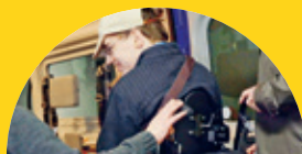
UNTERSTÜTZUNG – WERTVOLL ZU JEDER ZEIT